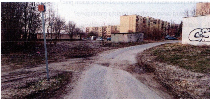
Zachęta: zdjęcia mieszkańca Gliwicz za jego zgodą